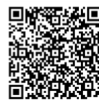
Lag og organisasjoner