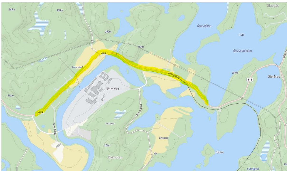
Fig. 1. Oversiktskart. Gul linje viser en grov oversikt over strekningen der skal planlegges GS-veg.