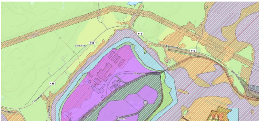
Fig. 3. Utsnitt av gjeldende planer for området. Det meste av området er avsatt til LNF. Området omfattes også av hensynssone faresone flomfare. Reguleringsplan for fv. 415 Simonstad – Selåsvatn sees lengst til høyre i bildet.

Planområdet er i gjeldende kommuneplan avsatt til LNF-formål. Fv. 415 er avsatt til samferdselsformål. Planområdet er uregulert med unntak av arealet lengst i øst som omfattes av reguleringsplan for fv 415 Simonstad – Selåsvatn. Deler av området omfattes av hensynsone flomfare. Det følger av bestemmelsene til kommuneplanen at hensynssona for flomfare for Nelaugvannet er satt til kote + 143. Se fig. 3. Planområdet grenser i vest til detaljreguleringsplan for Simonstad næringsområde som i skrivende stund ikke er vedtatt.