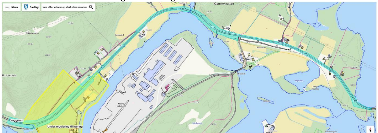
Fig. 4. Illustrasjonen viser boliger (gule hus), næringsområde under regulering (gjennomsiktig gul figur) eiendomsgrenser der veggrunn er markert turkis. Hentet fra kommunens notat.

Arealet som omfattes av fredningen er vist i fig. 4.